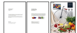
#1 Teks Hitam #2 Warna #3 Foto 4R

1 Kecepatan cetak (Pages Per Minute/Halaman Per Menit) dihitung saat dicetak pada kertas biasa A4 dalam mode tercepat, kecepatan cetak foto 10 x 15cm saat dicetak pada Epson Premium Glossy Photo Paper. Kecepatan cetak dapat bervariasi tergantung pada konfigurasi sistem, mode cetak, kompleksitas dokumen, perangkat lunak, jenis kertas yang digunakan dan konektivitas. Kecepatan cetak tidak termasuk waktu pemrosesan pada komputer utama.